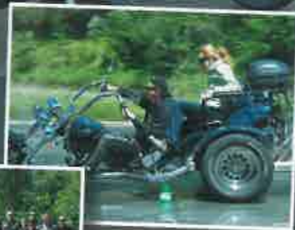
Bei Bedarf wird auch ein Hochzeits-Triko zur Verfügung gestellt.