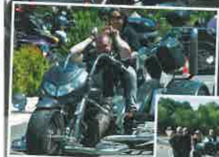
Fahrtraining ist nicht nur gut für die Sicherheit sondern kann noch richtig viel Spaß machen.